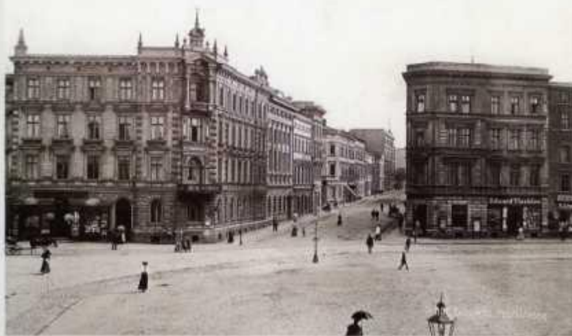
Katowice, początek XX wieku