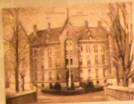
Oberschlesisches Museum in Gliwice, 1907 r.