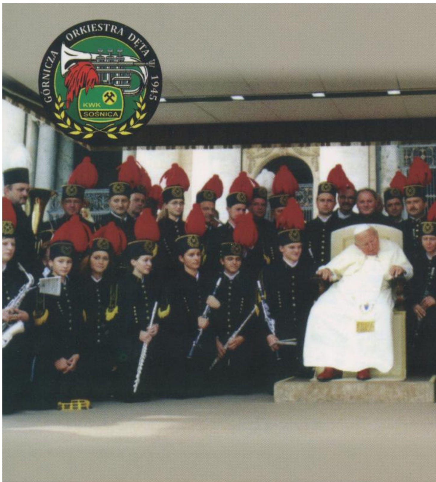
Orkiestra Dęta KWK Sośnica z Janem Pawłem II